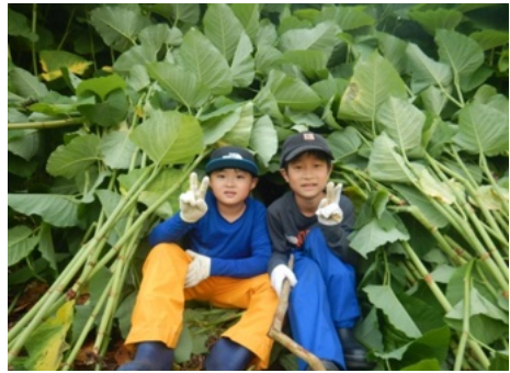
草はらでかくれんぼ