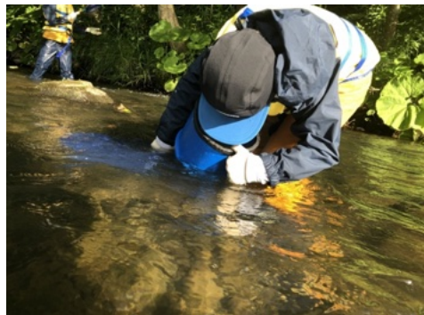
川での生き物探し