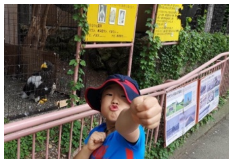
動物観察ミッション