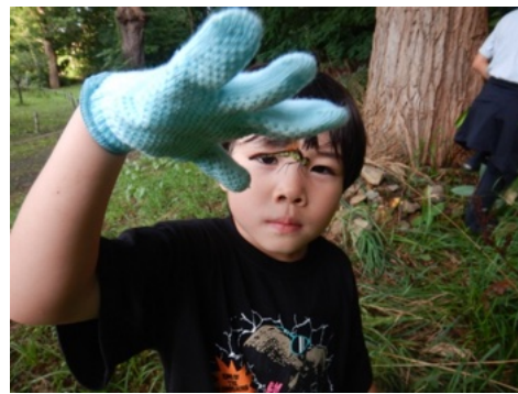
トンボを捕まえよう